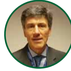
MARCELO CIMA Secretario de Relaciones Económicas del Ministerio de Relaciones Exteriores, Comercio Internacional y Culto