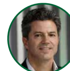
LUCIANO LASPINA Diputado Nacional por Juntos por el Cambio