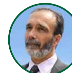
FABIÁN LÓPEZ Ministro de Servicios Públicos en Gobierno de Córdoba