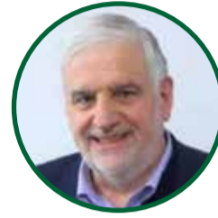
FERNANDO VILELLA Secretario de Bioeconomía de la Nación