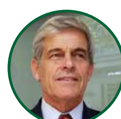
JOSÉ BONICA Presidente de INIA Uruguay