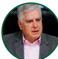
CARLOS GUTIERREZ Diputado Nacional por Hacemos Coalición Federal