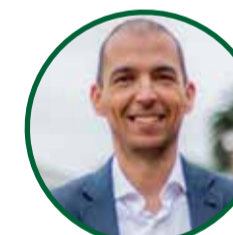
LUIS PICAT Diputado Nacional por la Unión Cívica Radical