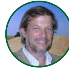
IGNACIO GARCARENDA Presidente del Congreso MAIZAR 2024